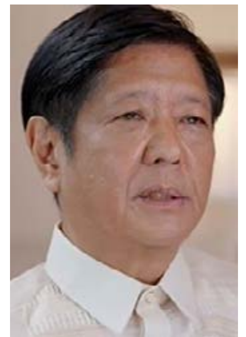
President Ferdinand Marcos Jr.

MANILA, Philippines — Naniniwala si Pangulong Ferdinand Marcos Jr. na bahaging destabilisasyon ang inihaing reklamo sa Supreme Court (SC) na kumukwestyon sa legalidad ng 2025 General Appropriations Act (GAA).