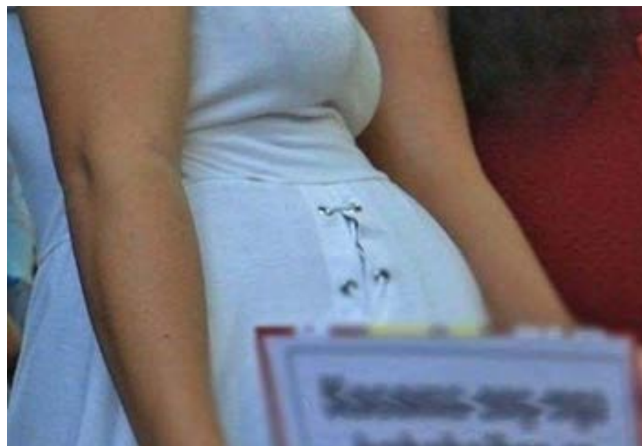
Batang-bata nabubuntis sa Pinas dumarami

Base sa datos ng Civil Registry and Vital Statistics, ibinunyag pa ni Tacardon na noong 2023, nai-