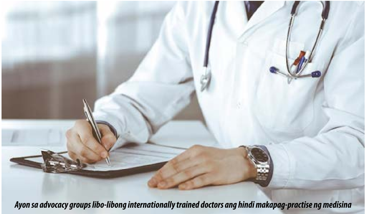
Ayon sa advocacy groups libo-libong internationally trained doctors ang hindi makapag-practise ng medisina

Narito ang ilan sa mga isyu: Lahat ng 13 probinsya at teritoryo ay may magkakahiwalay na licensing re-