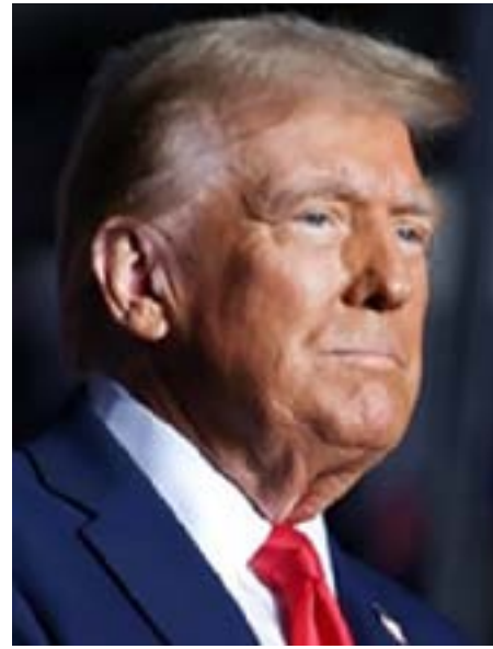
Pres. Donald Trump

na ibalik ang mga miyembro ng militar na tinanggal dahil sa pagtangga sa COVID-19 vaccine mandate, bibigyan ng back pay at ibabalik sa kanilang ranggo.