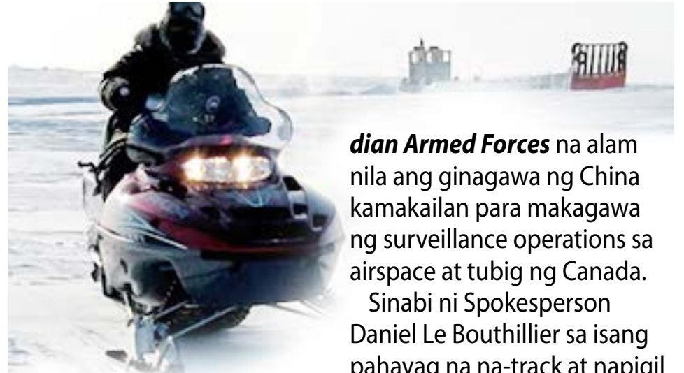
Sinabi ng Department of National Defense at Cana-

dian Armed Forces na alam nila ang ginagawa ng China kamakailan para makagawa ng surveillance operations sa airspace at tubig ng Canada.