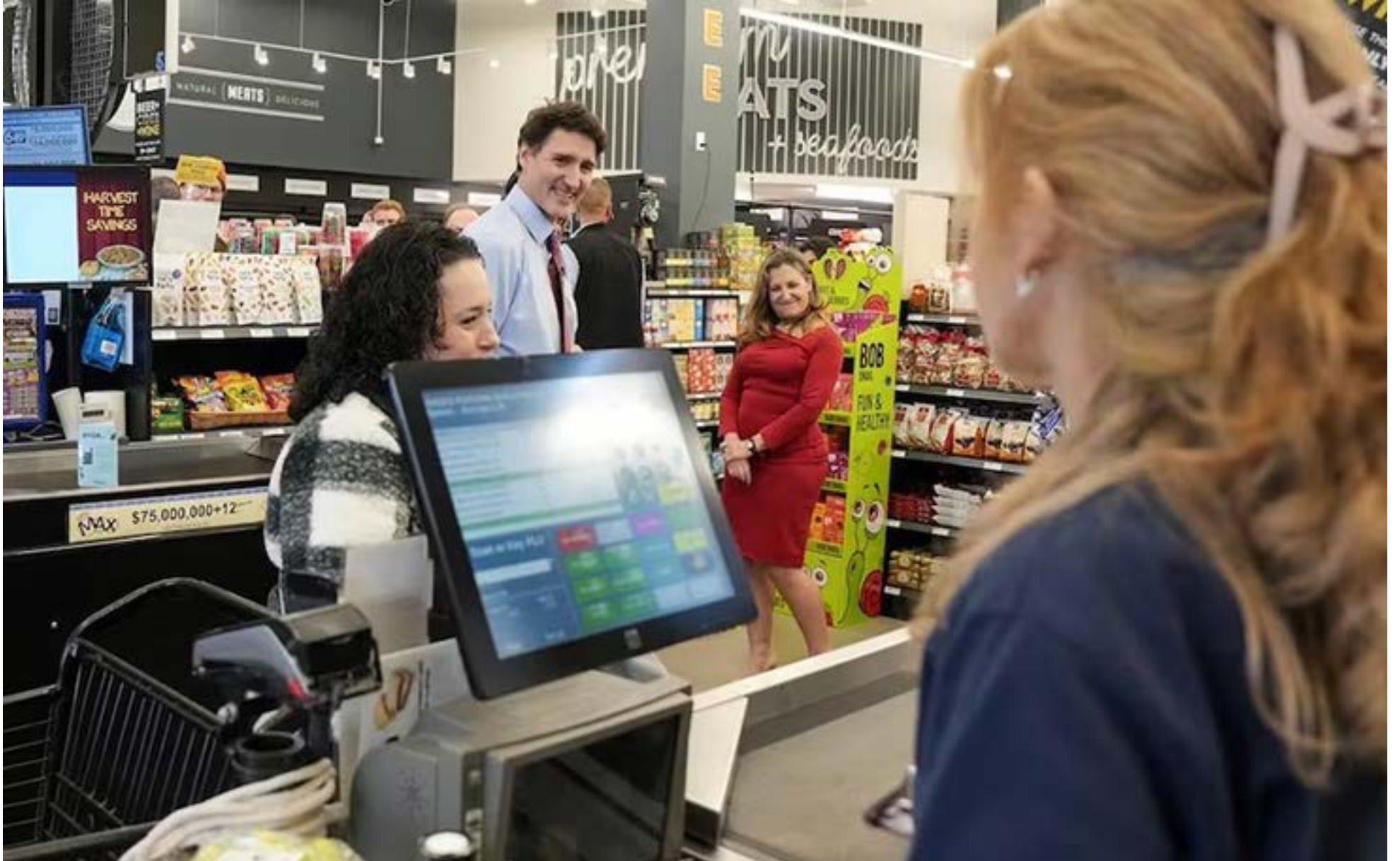
Prime Minister Justin Trudeau at Deputy Prime Minister Chrystia Freeland sa Vince's Market, isang grocery store sa Sharon, Ontario, nang inanunsyo ang GST/HST holiday

Ipapatupad ang GST/HST holiday ng Liberal na gobyerno na magtatagal ng dalawang buwan.