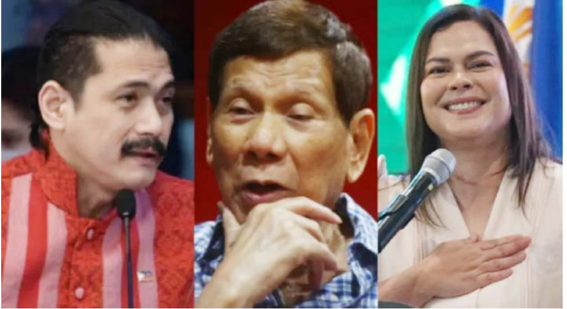
MULA SA KALIWA: Sen. Robin Padilla, Ex-Pres. Rodrigo Duterte, at VP Sara Duterte

Isiniwalat ni dating chief presidential legal counsel Salvador Panelo na kung sakaling ma-disqualify at ma-impeach si Vice President Sara Duterte, si Senador Robin Padilla umano ang patatakbuhan ni dating Pangulong Rodrigo Duterte bilang pangulo ng bansa sa 2028.