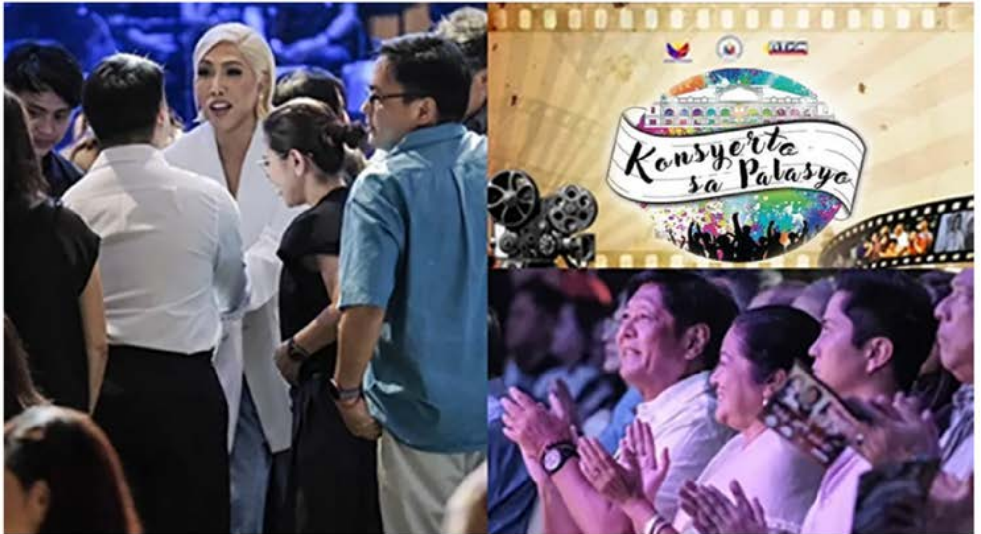
Isa sa mga bigating stars na dumalo sa ginanap na "Konsyerto sa Palasyo" si Unkabogable Star Vice Ganda, na muling nagbabalik-Metro Manila Film Festival (MMFF) para sa pelikulang "And The Breadwinner Is..." na mapapanood na sa Disyembre 25.

MANILA - Pinangunahan nina Pangulong Ferdinand "Bongbong" Marcos Jr. at First Lady Liza Araneta-Marcos ang tila enggrandeng pagsasama-sama ng mga artista sa " Konsyerto sa Palasyo ," nitong, Disyembre 15, sa Kalayaan Hall Grounds, Malacañang Palace, Maynila.