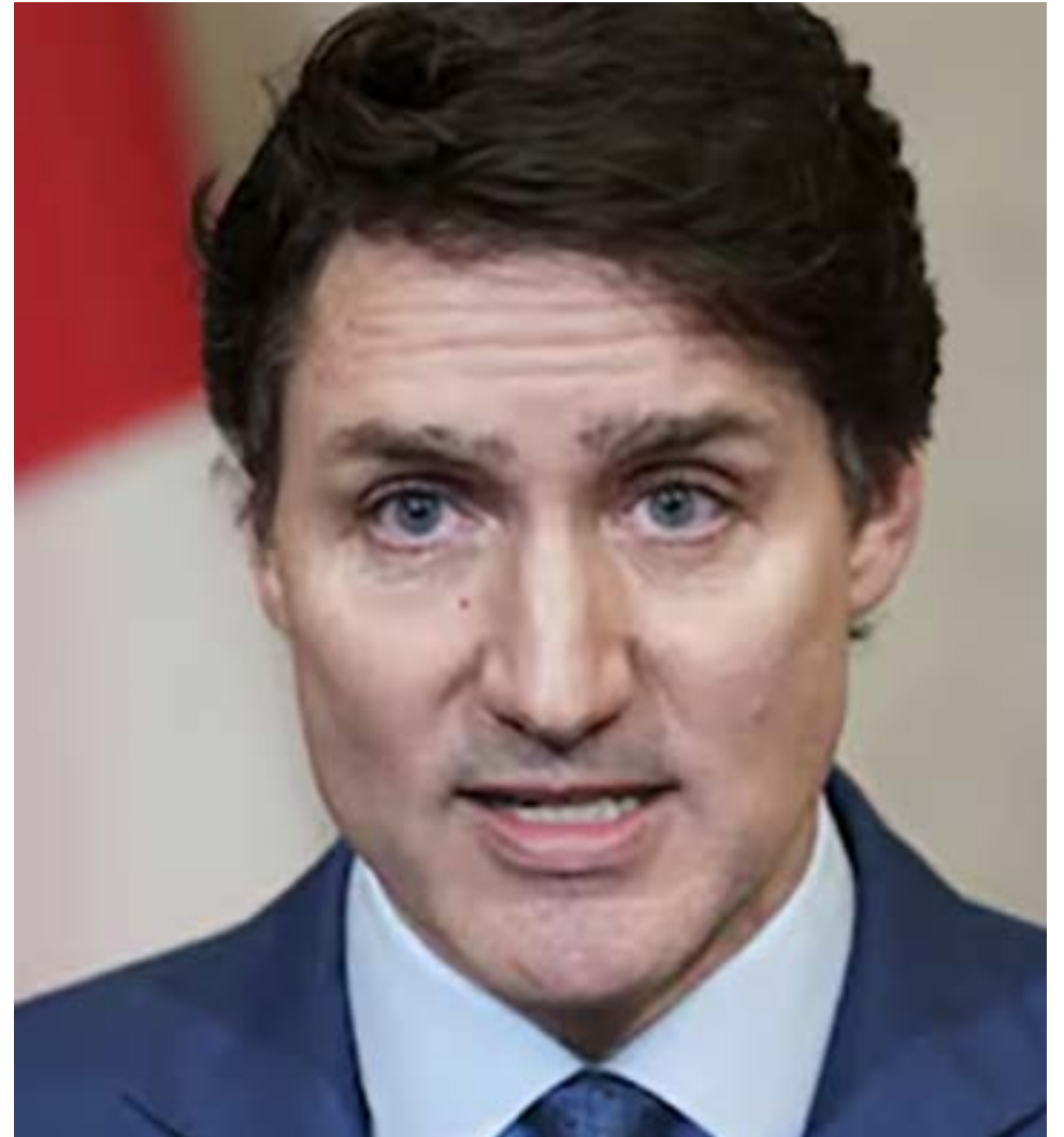
Prime Minister Justin Trudeau

Maniningil ng dagdag 25 porsyento ang Ontario para sa kuryente na ipinapadala sa 1.5 milyong Amerikano bilang tugon sa mga taripa ni U.S. President Donald Trump, sinabi ni Ontario Premier Doug Ford kamakailan. Nagbibigay ng kuryente ang Ontario sa Minnesota, New York at Michigan. Nitong unang bahagi ng linggo, nagbabala si Ford sa mga gobernador ng mga state na iyon tungkol sa mga paparating na pagbabago.