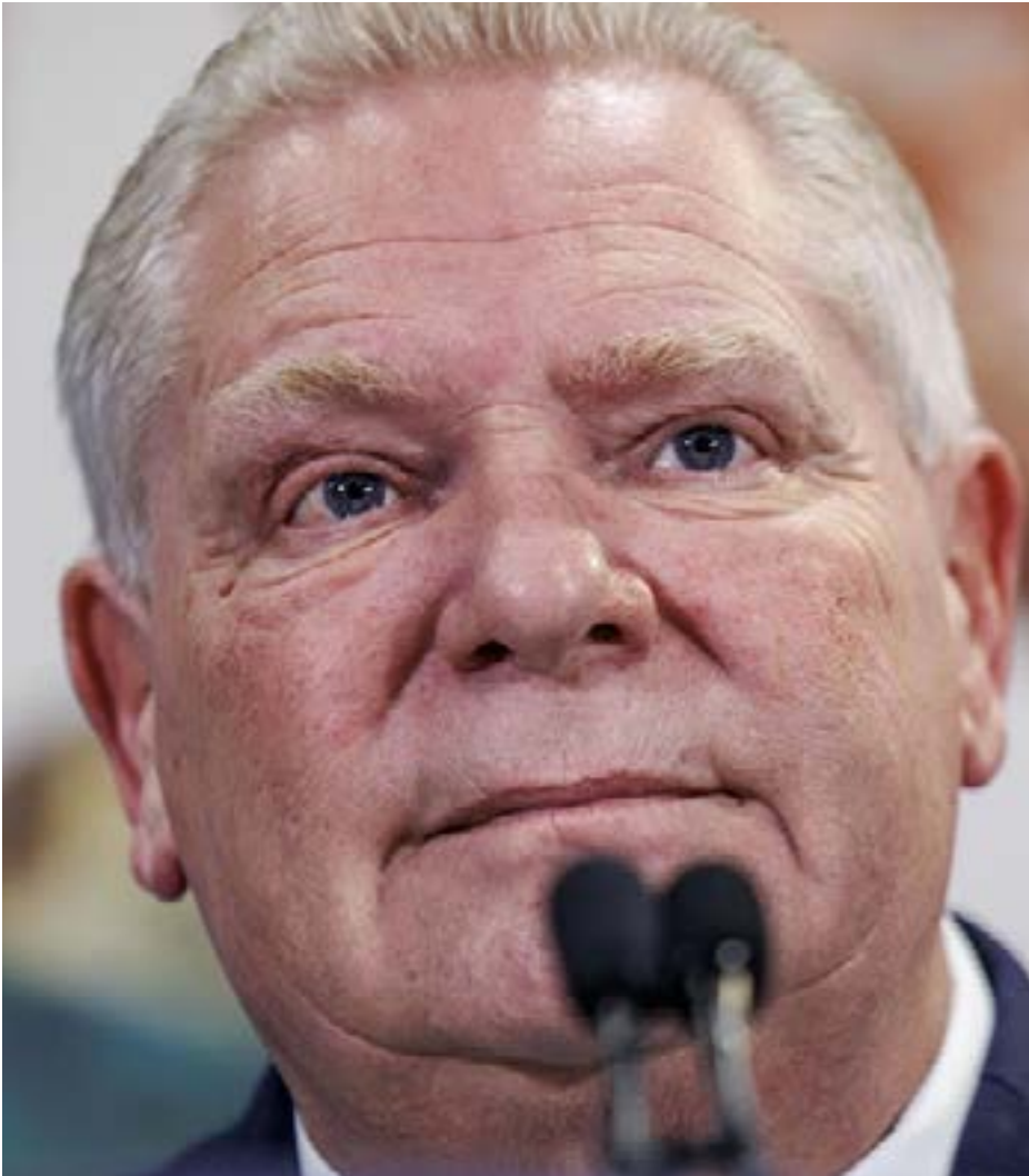
Ontario Premier Doug Ford