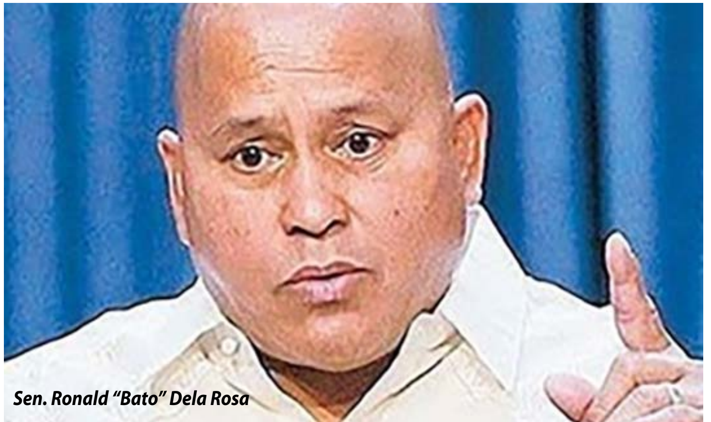
Sen. Ronald "Bato" Dela Rosa

na lamang niyang isusuko ang kanyang sarili.