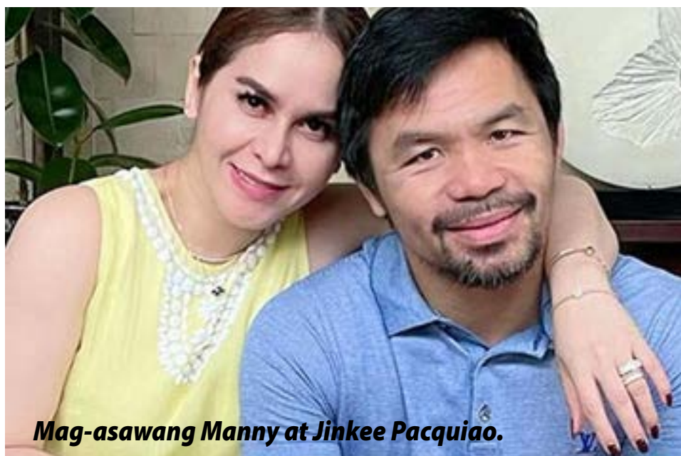
Mag-asawang Manny at Jinkee Pacquiao.

Ang tinatawag na "sexual immorality" daw ang nagiging dahilan umano ng lumalalang teenage pregnancy sa Pilipinas, ayon sa Pambansang Kamao na si Manny Pacquiao.